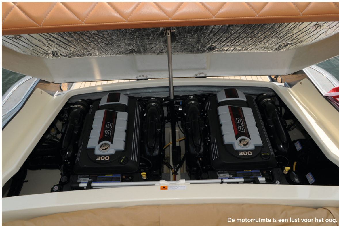
De motorruimte is een lust voor het oog.