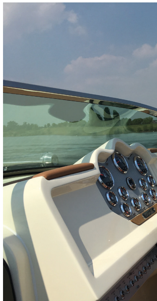
Nieuw schakelpaneel met verlichte schakelaars

De grote U-vormige bank leent zich met -aangebrachte kuintafel- bij uitstek voor het nuttigen van een smakelijke tapas maaltijd met vrienden, maar met een kleiner gezelschap kun je er bovendien perfect beschut loungen; een kwestie van de s-kussens achter het zitgerei omdraaien en je ligt als een vorst en vorstin, turend naar de zonsondergang. Het grote zonnebed boven de 16-cilinders is minstens zo uitdagend. De met teak belegde RVS voetsteunen bieden uitkomst als de stuurman per abuis te schielijk de toeren mocht opjagen en dienen tegelijkertijd als houvast als je vanuit het