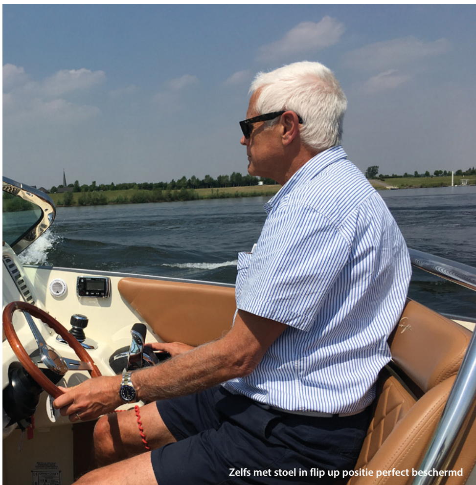
Zelfs met stoel in flip up positie perfect beschermd

water de zwemtrap bestijgt. Niet zelden is dit een regelrechte uitdaging, maar de ontwerpers van Chris Craft hebben het goed begrepen. Dit geldt bijvoorbeeld ook voor de instap vanaf de spiegel; het middenkussen kan simpel worden weggenomen zodat je met een tussenstapje op stroef teak zonder de fraaie bekleding te bevuilen kunt in- of uitstappen. Weer zo'n doordachte oplossing is het scharnierende kuptafeltje dat met een simpele beweging vanuit ruststand in de bakskist in stelling kan worden gebracht. Over de uitwendige lijnen van deze Corsair 30 kunnen wij redelijk kort zijn: het is een typische Amerikaanse runabout, dus met een klasieke waaierstev, getint windscherm, toelopend achterschip met zonnedeck en veel RVS details.